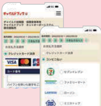
コンビニ決済のお支払期限は 1週間以内です