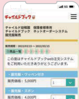
注文画面は一例です